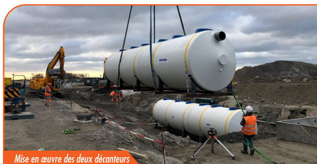
Mise en œuvre des deux décanteurs

Le projet consiste à gérer et traiter les eaux de ruissellement du site de 23 hectares à l'occasion de l'extension de la zone de stockage des containers sur le port de Dunkerque. Un stockage temporaire des eaux de ruissellement en réseaux, suivi d'un pompage, alimente deux décanteurs lamellaires de débit unitaire 116 l/s, avant rejet en mer.