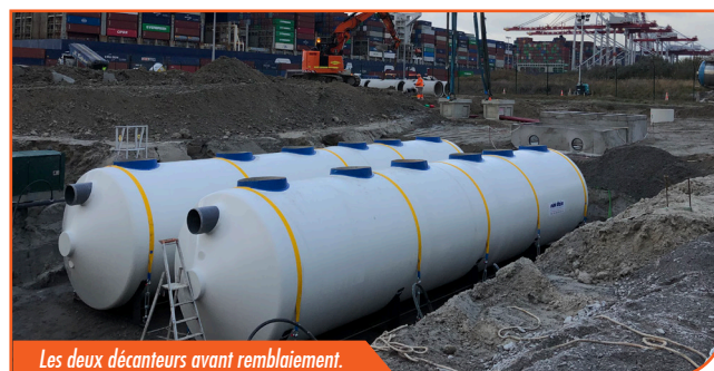
Les deux décanteurs avant remblaiement.