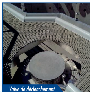
Valve de déclenchement