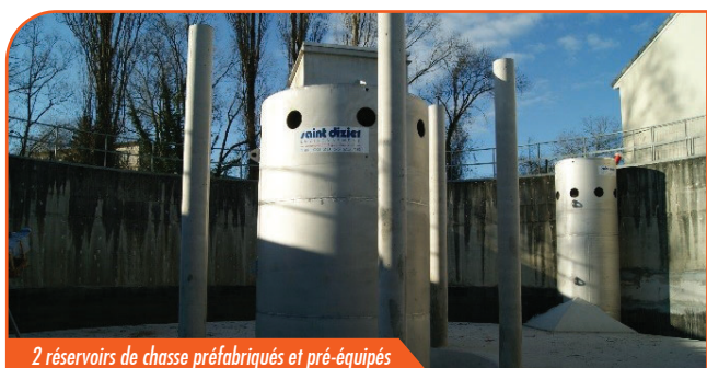
2 réservoirs de chasse préfabriqués et pré-équipés

Construit en 1992, le bassin d'orage Saint François de Marange Silvange a subi une réhabilitation récente avec la mise en place d'un système de nettoyage automatique. Ce bassin à ciel ouvert se situe par ailleurs à quelques mètres des habitations. Un appel d'offre a été lancé avec pour problématique principale : respecter la tranquillité du voisinage.